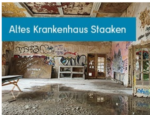
Altes Krankenhaus Staaken